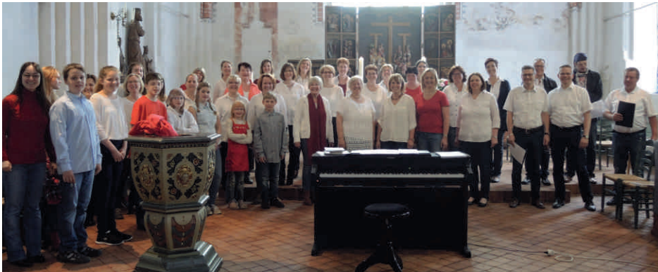
Der Gospelprojektchor 2016